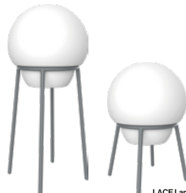
LACE Lampara Low LACE Lamp Low

LED RGB AUTONOMY: 8h CHARGE TIME: 6h BATTERY: Removable REMOTE CONTROL